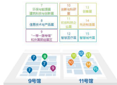
深圳國際會展中心(寶安) 展館平面圖

是屆高交會超過 4100 家展商，線下 11 個、線上 26 個國家和國際組織參加，現場觀眾近 15 萬人次，亦有有天津、山東等 9 家省市展團，清華大學、北京大學等 14 所學府展示研究成果。高交會由中國商務部、科學技術部、工業和信息化部、國家發展和改革委員會、農業農村部、國家知識產權局、科學院、工程院和深圳市人民政府共同主辦。高交會是中國最具影響力的科技類展會，在推動高新技術成果商品化、產業化、國際化，及促進國家、地區間的經濟技術交流與合作中發揮重要的作用。(高交會大會報告請留意 高交會網頁 公佈)